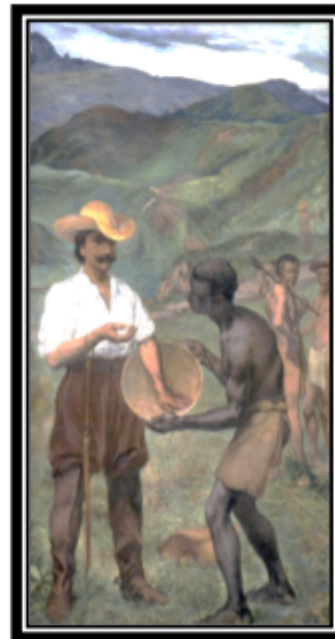
Ciclo do Ouro Rodolfo Amoedo