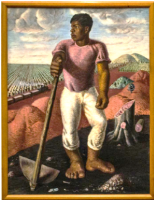
O Lavrador de Café Candido Portinari

Observe as obras para responder as atividades 1 e 2.